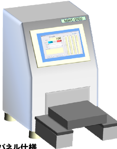
タッチパネル仕様